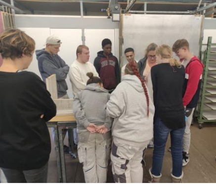
Vorstellung der Vorgehensweise