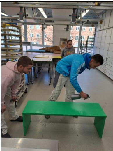
Untergründe für Folien vorbereiten