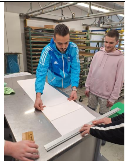
Folien messen und schneiden