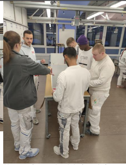
Unterweisung der Arbeitsschritte