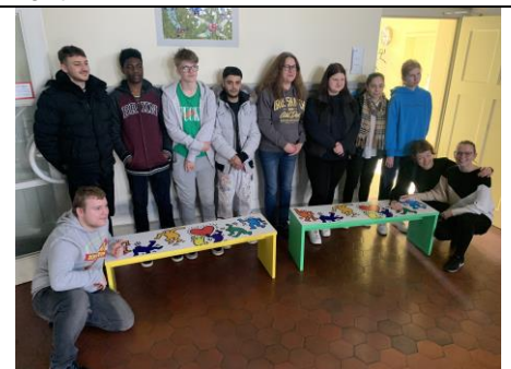
Die stolzen Teilnehmer und ihr Projekt