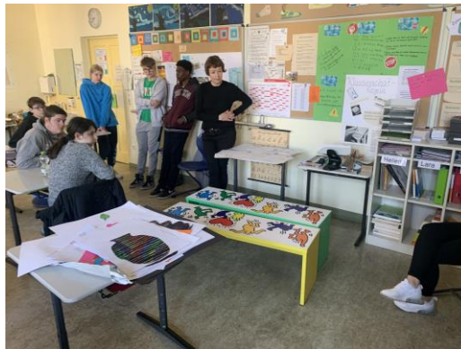
Präsentation im Unterricht