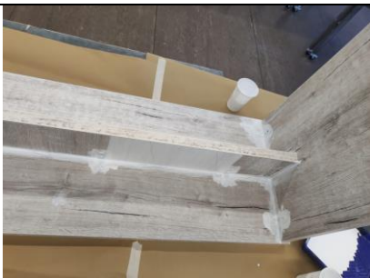
Ausbesserung / Vorlackierung