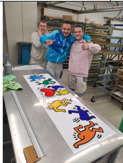
Alles hat geklappt!!!